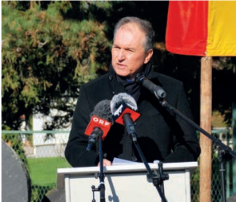
Der deutsche Botschafter Vito Cecere appellierte bei der Veranstaltung, völkischen und rassistischen Narrativen entgegenzutreten.

und Opfer brutaler Gewaltakte werden. Gegen Antisemitismus und Rassismus muss in Europa konsequent, rigoros und geeint vorgegangen werden.“