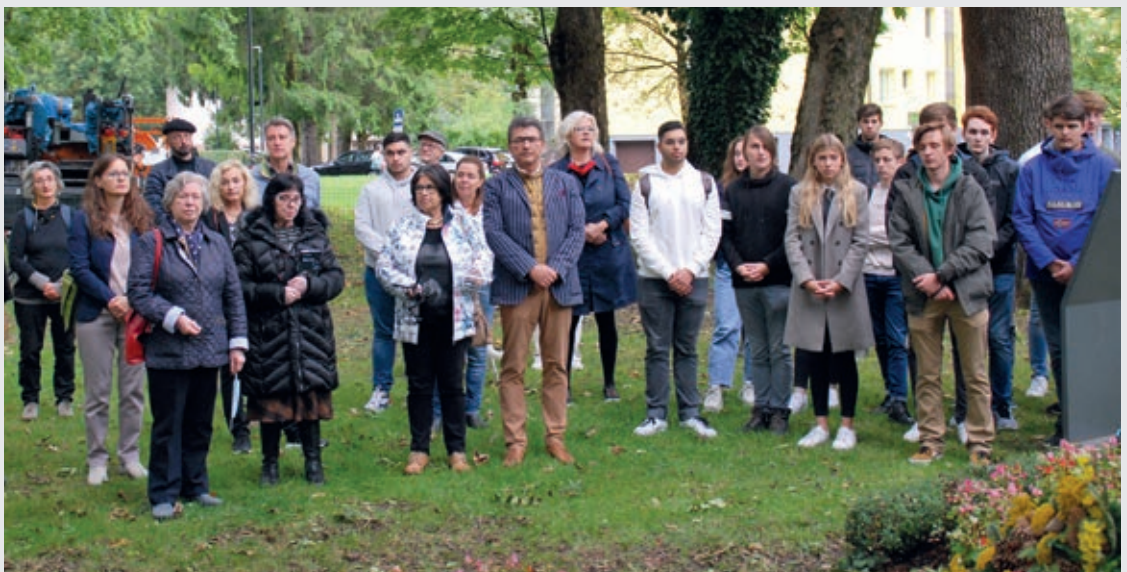
Ursprünglich war die Gedenkveranstaltung für April 2020 geplant, konnte aber wegen des Corona-Lockdowns im Frühjahr nicht stattfinden.

Während der nationalsozialistischen Herrschaft wurden in der Stadt Salzburg beim ehemaligen Trabrennplatz Roma und Sinti aus der Stadt und aus den Salzburger ländlichen Regionen zusammengetrieben, um sie nach dem gewonnenen Blitzkrieg gegen Polen dorthin zu verfrachten. Für die über 220 registrierten Personen war die Salzburger Rennbahn nur Zwischenstation, und zwar von Mitte Juli 1940 bis 10. September 1940. Dann mussten die Pferdeställe wieder geräumt, die Boxen den Rennpferden überlassen werden. Danach ging es zum „Sammelplatz Maxglan“, der zwischenzeitlich zum streng abriegelten Lager ausgebaut worden war. Ende März / Anfang April 1943 wurde das Lager Maxglan aufgelassen. Die Mehrzahl der rund 300 Roma und Sinti wurde in das KZ-Auschwitz deportiert, eine kleinere Gruppe kam in das sogenannte „Zigeuner-Anhaltelager“ Lackenbach.