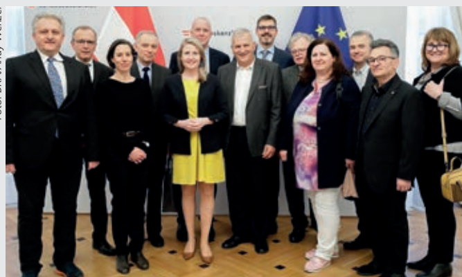
Volksgruppenbeiratsvorsitzende und deren StellvertreterInnen mit Bundesministerin Christine Raab (im gelben Kleid).